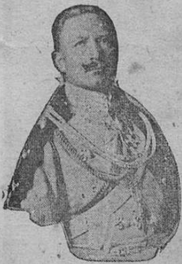
El Emperador de Alemania.

NOTICIAS DEL CAMPO DE OPERACIONES SERBIO. — COMBATE ENCARNIZADO CON LOS AUSTRIACOS. — LOS SERBIOS RESISTEN LA INVASION.