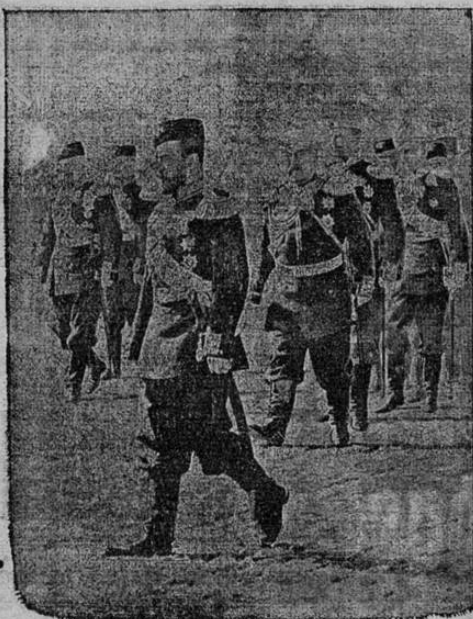
Nicolás II de Rusia y su Estado Mayor.

PARIS, 31.—Los alemanes están concentrados en la frontera; fortifican las posiciones estratégicas y han establecido el servicio de exploradores y rondas en la frontera.