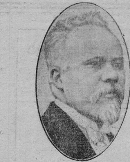
M. Raymon Poincaré, Presidente de la República francesa.