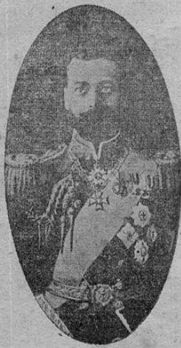
Jorge V de Inglaterra.

El Drina es un río de la península de los Balcanes, que nace en los Alpes dináricos, al Norte de Montenegro y desemboca en el Save. Curso muy accidentado de 350 kilómetros.