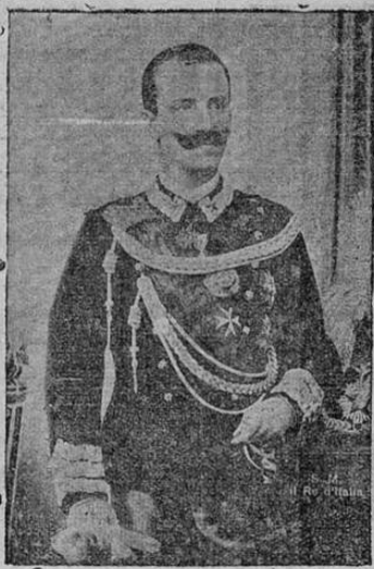
Victor Manuel III, Rey de Italia.

Tsientan, y el cañonero italiano "Sebastiano Cabalo" marcha en dirección de este puerto.