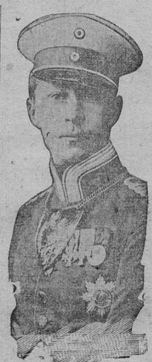
Príncipe heredero de la Corona alemana.

ción de la ley marcial es un anuncio de que se tomarán medidas para proteger los ferrocarriles restringiendo la comunicación por teléfono, telégrafos, correos y ferrocarriles. El ejército domina completamente la situación. Conforme el artículo 78 de la Constitución, Baviera queda excluida del movimiento y se hace preciso dar un decreto especial para su participación. El Kronprinz comandará la primera división de la guardia imperial. La Princesa de la Corona regresó de Meklenburgo; el Rey de Sajonia llegó a Dresde, procedente de Suiza. Por todas partes se ve la evidencia de los preparativos para la rápida movilización. Los grandes Bancos oficiales se preparan financieramente; muchas