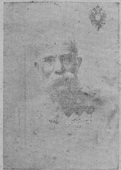
Francisco Jose, Emperador de Austria.

NOTA.—La ciudad de Wellington es la capital, y desde 1856 la sede del Gobierno de Nueva Zelanda, en la extremidad meridional de North Island, en el estrecho de Coosk. La mencionada capital tiene